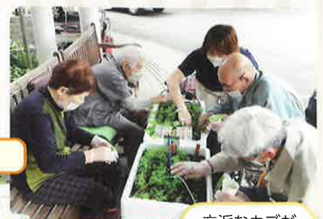
立派なカブが できました♪