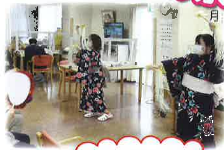
たくさんの声援 ありがとうございます